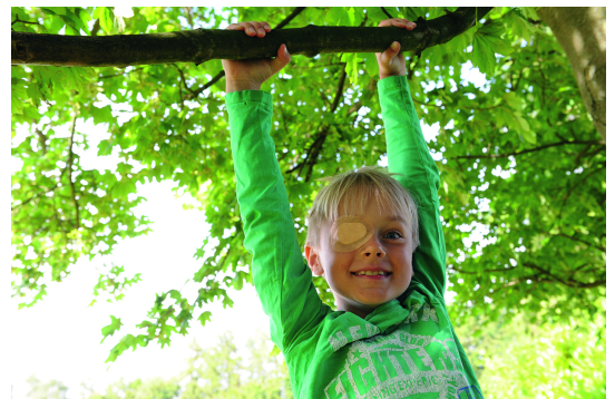
Abb. 5 Abklebebehandlung

Wenn ein Kind wegen Hautreaktionen das Pflaster nicht verträgt, kann augenärztlich eine Stoffkapsel oder bei Versagen dieser Methode halbdurchsichtige oder undurchsichtige Folien für das Brillenglas verordnet werden.